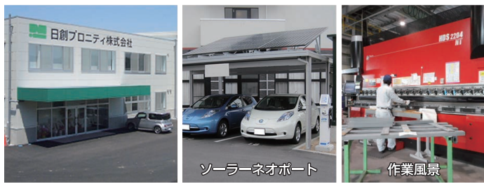
ソーラーネオポート